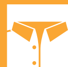
COL DE CHEMISE